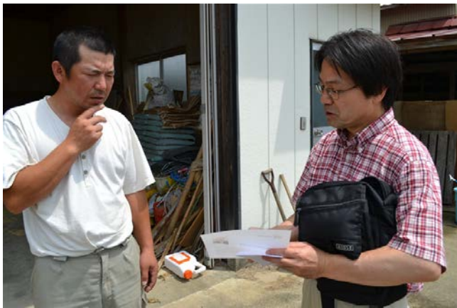
Oikawa Feedlot (Wagyu fattening farmer)