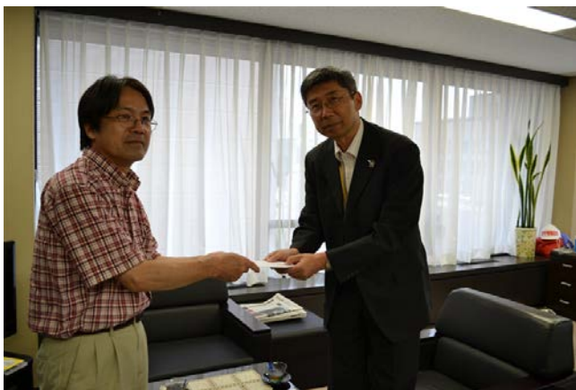
JA Miyagi Chuoukai (Agricultural co-op)