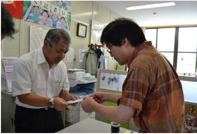
JA MiyagiTome (Agricultural co-op)