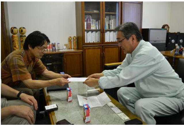
Michinoku Milk Ltd. (Dairy industry maker)