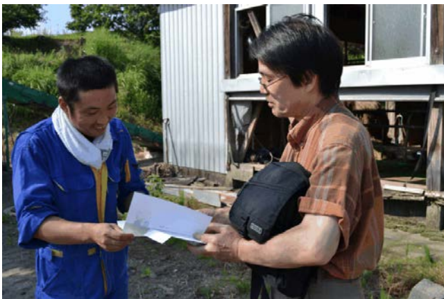
Suzuki Farm (Dairy farmer)